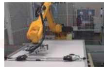
拔出插头 Disassemble the lead