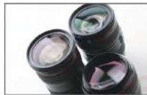
视觉定位 Vision localization